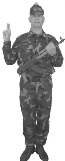
72. ábra „Eskü” esetén a katona kéztartása (fegyverrel)

Az esküt tevők az előolvasó tiszthelyettest követve egyszerre, hangosan mondják az eskü szövegét.