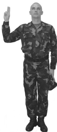
71. ábra „Eskü” esetén a katona kéztartása (fegyver nélkül)

A zenekar játssza Erkel Ferenc: Bánk Bán című operájából a „Hazám, hazám” kezdetű ária zenekari feldolgozását. Az esküt előolvasó tiszthelyettes az eskü szövegét hangosan, érthetően, hangsúlyozva és az egyes szakaszok között szünetet tartva olvassa.