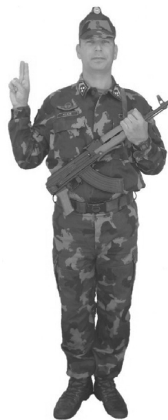
72. ábra „Eskü” esetén a katona kéztartása (fegyverrel)

Az esküt tevők az előolvasó tiszthelyettest követve egyszerre, hangosan mondják az eskü szövegét.