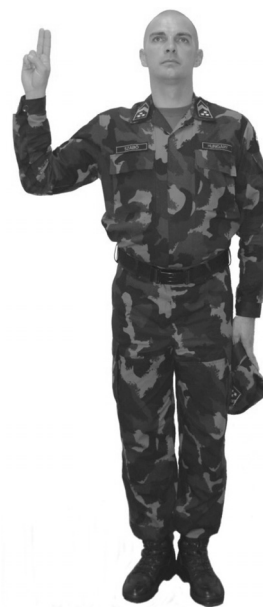
71. ábra „Eskü” esetén a katona kéztartása (fegyver nélkül)

Amennyiben az esküt tevők fegyver nélkül vannak, a vezényszó „Eskü” részére a „Sapkát le!” vezényszó 1. ütemét, a vezényszó „-höz!” részére a 2. és 3. ütemét hajtják végre. Az esküt tevők jobb alkarjukat egy gyors mozdulattal emeljék fel úgy, hogy tenyerük a jelentkezésnek megfelelő tartással, mutató és középső ujj kinyújtva előre nézen.