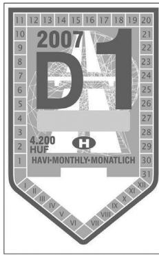
Matrica előlap Értékesítéskor nem látszik