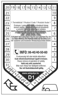
Matrica hátlap Értékesítéskor látszik