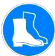
Lábvédő használata kötelező