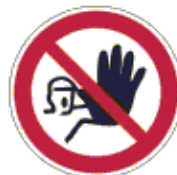
Illetékteleneknek belépni tilos