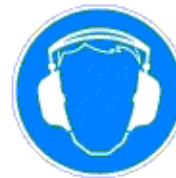
Hallásvédő használata kötelező