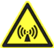
Nem ionizáló sugárzás