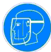
Arcvédő használata kötelező