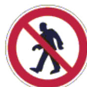
Gyalogosok számára tilos