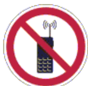
Rádiótelefon használata tilos