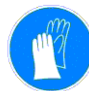
Védőkesztyű használata kötelező