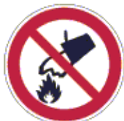
Vízzel oltani tilos