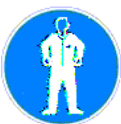
Védőruha használata kötelező