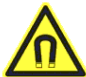
Erős mágneses tér