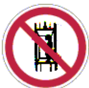
A felvonón személy-szállítás tilos