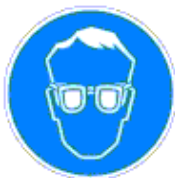
Védőszemüveg használata kötelező

Fehér piktogram kék alapon. A kék szín a jel felületének legalább 50%-át teszi ki.