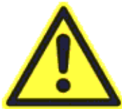
Általános veszély (Ez a figyelmeztető jel nem használható arra, hogy figyelmeztessen a veszélyes vegyi anyagokra és keverékekre, kivéve, ha a figyelmeztető jelet a 9. § (8) bekezdésének megfelelően veszélyes anyag vagy keverék tárolóinak jelölésére használják.)