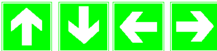
Íránymutató (kiegészítő táblaként)