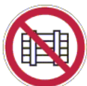
Erre a helyre rakodni tilos