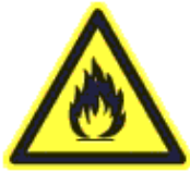
Gyúlékony (tűzveszélyes) anyag vagy magas hőmérséklet (ha a magas hőmérsékletre nem figyelmeztet külön jel)

Fekete piktogram sárga alapon, fekete szegély. A sárga szín a jel felületének legalább 50%-át teszi ki.