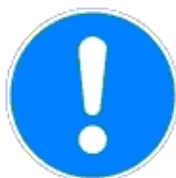
Általános utasítás (kiegészítő jelzéssel)