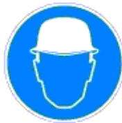
Fejvédő használata kötelező