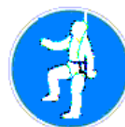
Testhevederzet használata kötelező