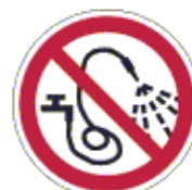
Vízzel locsolni tilos