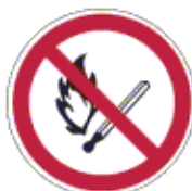
Nyílt láng használata és dohányzás tilos