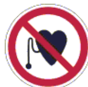
Szívritmus-szabályozóval belépni tilos