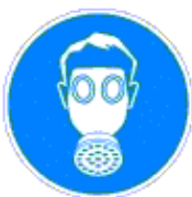
Légzésvédő használata kötelező