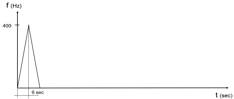
Morgató próba jelzés

A jelzés leírása: A próba során alkalmazott jelalak első részében 6 másodperces időtartamban 400 Hz-ig felfutó jelzés kerül leadásra, majd a jel lefutása következik be.